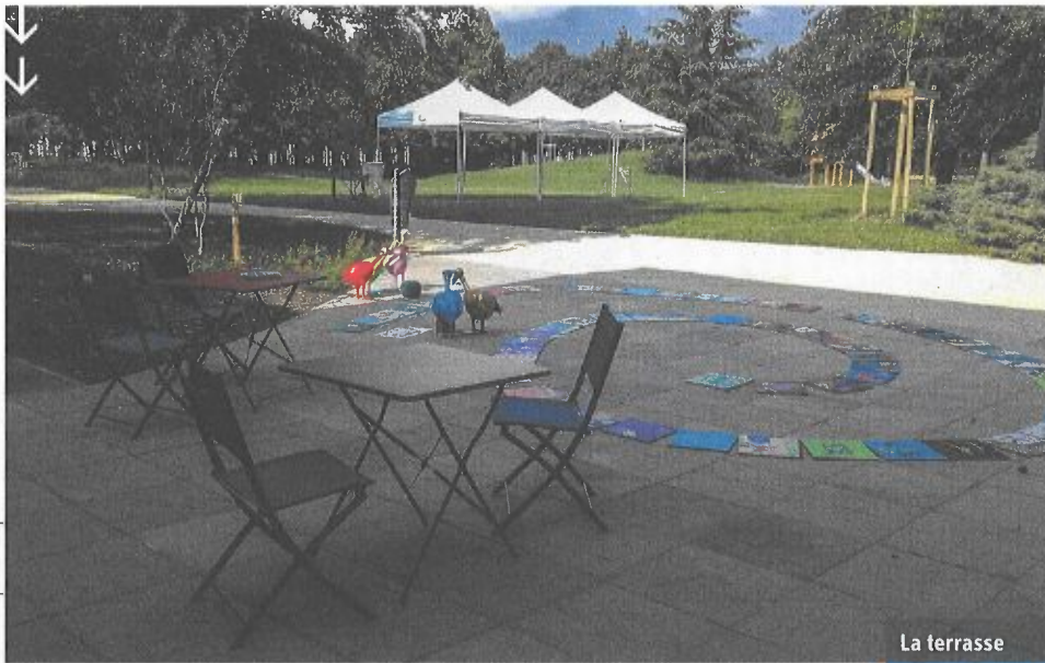
La terrasse attendant.

Pour laisser place aux usagers et aux services, les espaces intérieurs ont été revus : moins de rayonnages, une présentation attractive et évolutive des collections (meubles bas, pôles documentaires), plus de places assises (de toutes sortes), des roulettes partout pour faire vivre la modularité des espaces.